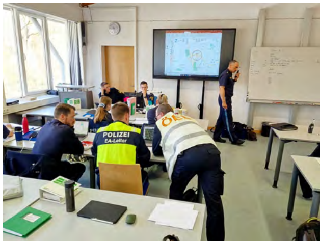
Der ÖEL bespricht sich mit dem EA-Leiter 1

Seit einigen Jahren steht auf dem Lehrplan des 2. ftA im Fach Einsatzmanagement das Thema GGSK (Größere Schadenslagen/Katastrophen). Hierbei werden die Studierenden in der Theorievermittlung auf derartige Einsätze vorbereitet. Ziel ist es u. a., im Einsatzfall die enge Zusammenarbeit mit den Fachdiensten, wie Feuerwehr, Rettungsdienst und THW aufzuzeigen. Neben der Theorie stehen zum Abschluss der Thematik ein virtuelles Training sowie ein Einsatzführungstraining als praktische Übung auf dem Plan. Dabei soll das Erlernte anhand eines fiktiven Schadensszenarios in die Praxis umgesetzt werden.