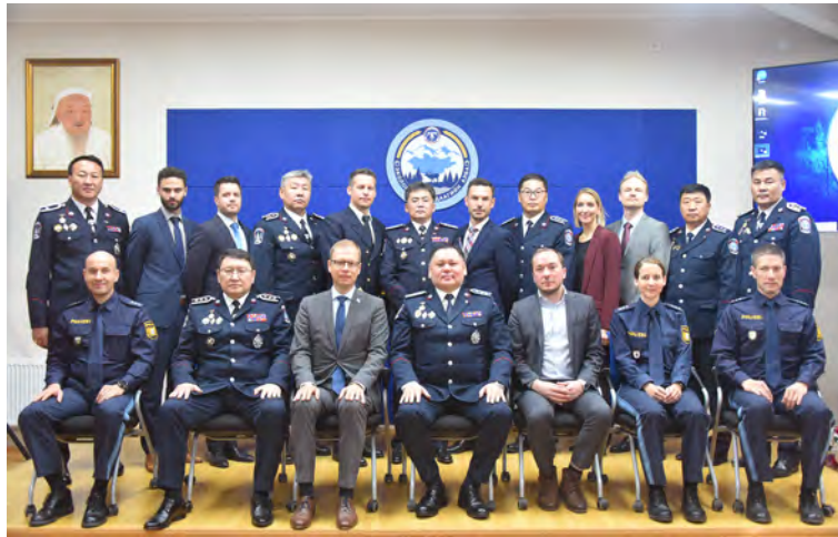
Gruppenbild beim Besuch der Umweltpolizei

Neben den offiziellen Besuchen erwies sich, erwartungsgemäß, vor allem der inoffizielle Teil als gewinnbringend. Die Delegation bekam intensiv den hohen Stellenwert der Gastfreundschaft in der mongolischen Tradition zu spüren. Gerade dieser informelle Austausch und das hohe Interesse, das die mongolische Seite den Ideen und Lösungsvorschlägen der deutschen Seite entgegenbrachte, unterstrichen, wie lohnend ein solcher Austausch sein kann. Gastfreundschaft ist für Mongolen eben keine reine Pflichtaufgabe, sondern ein Lebenskonzept, an dem die Delegation teilhaben durfte. Für die Teilnehmer der Fahrt bleibt am Ende der intensive Kontakt mit Land und Leuten. Ein Eindringen in eine polizeiliche Führungskultur, die im Aufbruch befindlich ist, und unserer teilweise gleicht, teilweise aber auch noch in sozialistischen Autoritätsstrukturen verhaftet ist. Am Ende bleibt die wichtigste Erkenntnis: Kein fachtheoretischer Unterricht kann jemals vermitteln, was die Studierenden in einer