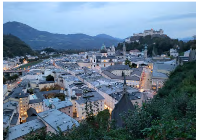
Die Mozartstadt am Abend