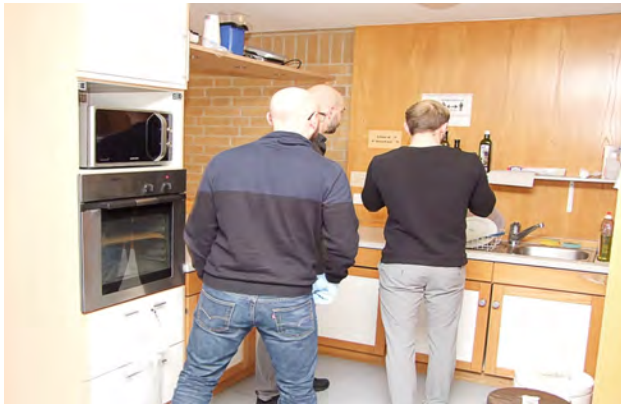
Tatortarbeit in der Küche der Verstorbenen

Die Studierenden sind hier gefordert, neben der Tatortarbeit eine Leichenschau durchzuführen und anschließend einen Tatbefund- und einen Spurenbericht sowie eine Lichtbildtafel zu erstellen. Im Rahmen des Todesermittlungsverfahrens sollen sie alle Umstände klären, die für ein Tötungsdelikt, ein Unfallgeschehen oder einen Suizid sprechen und letztlich zu einem fundierten Ergebnis kommen, analog der Vorgehensweise in der polizeilichen Praxis.