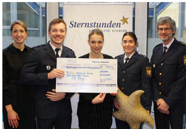
Der Gesamterlös wurde am 1. Februar 2023 von einer Abordnung des Fachbereichs Polizei an die Aktion Sternstunden in München übergeben

Drei unterschiedliche Jahresausklänge, die aber doch eines gemeinsam hatten: Studierende, Dozierende und Verwaltungsmitarbeiter/-innen der Hochschule waren aufgerufen, für die Benefizaktion „Sternstunden“ des Bayerischen Rundfunks zu spenden. Insgesamt konnten dabei knapp 3.900 Euro gesammelt werden.