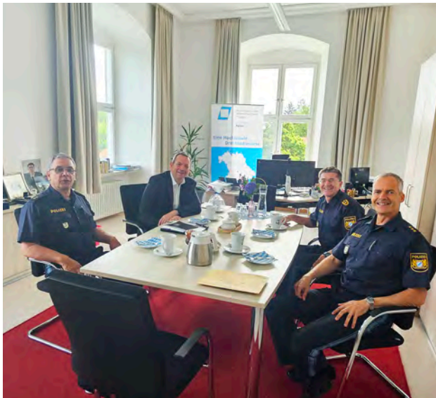
LPP Schwald (2. v.l.) im Gespräch mit der Hochschulleitung

Am 31. Juli 2023 stattete der Landespolizeipräsident Michael Schwald dem Fachbereich Polizei in Fürstenfeldbruck einen Arbeitsbesuch ab. In einem intensiven Austausch mit der