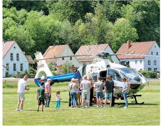
Besichtigung des Polizeihubschraubers

Über 5.000 Besucherinnen und Besucher nutzten die Möglichkeit, den neuen Hochschulstandort zu besichtigen und machten die Veranstaltung zu einem sehr gelungenen Ereignis.