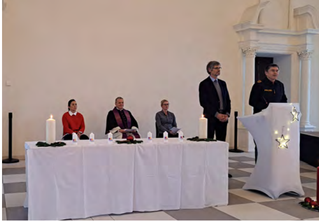
Die Fachbereichsleitung begrüßt zur ökumenischen Weihnachtsandacht im Churfürstensaal

Kurz vor den Feiertagen wurde am 22. Dezember schließlich am Studienort Fürstentfeldbruck im Zuge einer ökumenischen Weihnachtsandacht unter Leitung des Herrn Msgr. Andreas Simbeck (Polizeiseelsorger) auf den Höhepunkt der besinnlichen Zeit vorbereitet. Für die musikalische Untermalung sorgte dabei ein Bläserensemble des Polizeiorchesters Bayern.