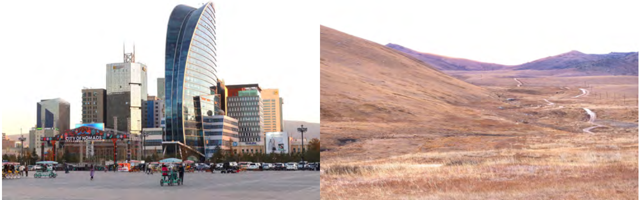
Land der Kontraste - Moderne Großstadtatmosphäre in Ulan Bator und totale Abgeschlossenheit auf dem Land

Delegation der Ratsanwärter zu Gast in der Mongolei