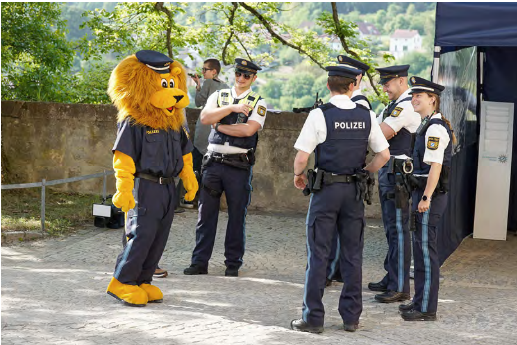
Auch Lexi, das Maskottchen der Bayerischen Polizei, feierte mit