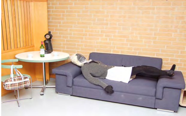
Auffindesituation der Leiche mit über den Kopf gezogener Plastiktüte in der Wohnung der Verstorbenen

pariert, an dem sich ein Todesfall ereignet hat. Die „Tatortgruppe“ teilt sich eigenständig auf, die eine Hälfte arbeitet den Tatort des Raubüberfalls, wie oben beschrieben, ab, während die andere Hälfte damit beschäftigt ist, die Todesermittlungen durchzuführen. Hierzu wurde ein vermeintlicher Suizid durch Erstickung simuliert.