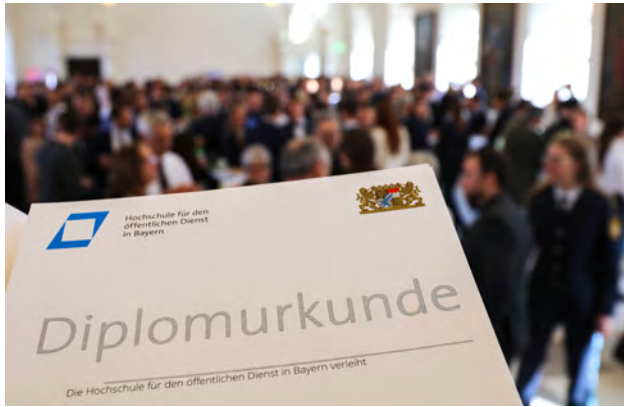
Das Objekt der Begierde

Noch vor der ersten Diplomierungsfeier im September 2023 ( siehe Seite 11 ) feierten bereits 221 Diplomandinnen und Diplomanden ihren Abschluss. Am Dienstag, den 28. März 2023, waren sie mit ihren Partner/-innen, ihren Eltern und ihren Kindern, gemeinsam mit hochrangigen Vertretern des Bayerischen Landtages und der Kommunalpolitik, der Bayerischen Polizei und Justiz sowie der Hochschule für den öffentlichen Dienst in Bayern zu ihrer eigenen Abschlussfeier eingeladen.