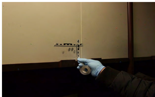
Spurensicherung im Innern des Obi-Marktes

fachkundigen Dozenten KHK Feistel und EKHK Prießnitz, daktyloskopische Spuren, Werkzeug-, Faser-, Schuh- und DNA-Spuren zu suchen und zu sichern. Zudem wird den Studierenden hier aufgezeigt, dass sich die Tatortgruppe mit den Vernehmenden rasch und permanent austauschen muss, um beispielsweise den Aktionsraum der Täter richtig zu erfassen, was Auswirkungen auf die Tatortarbeit hat. Umgekehrt liefert letztere wichtige Hinweise im Hinblick auf Spurenlagen, die für den Vernehmungsbeamten wichtig sind, um die Glaubwürdigkeit einordnen und den Tatablauf nachvollziehen bzw. verifizieren zu können. Eine Vorgehensweise, die in der polizeilichen Praxis Standard ist, aber in der jeweiligen Lage organisiert werden muss, damit die Vernehmungssituation aber auch die Tatortarbeit nicht massiv beeinträchtigt oder nachhaltig gestört wird.