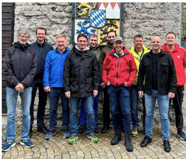
Das Fachgebiet 1 vor dem Bayerischen Staatswappen am Stolzenberghaus

Die Dozenten des Fachgebietes 1 – Verfassungs- und Eingriffsrecht – trafen sich am 12. und 13.05.2023 zu einer Besprechung auf dem Stolzenberghaus, einer Fortbildungsstätte der Bayer. Polizei, in der Nähe des Spitzingsees/ Marktgemeinde Schliersee. Hier waren rechtliche Problemstellungen ebenso Thema, wie die künftige organisatorische Ausrichtung. Diese Gespräche wurden selbst auf der gemeinsamen Wanderung zum Rotwandhaus und am Abend bei einem Gläschen Wein fortgesetzt. Das Fazit dieser Veranstaltung fiel gerade deshalb sehr positiv aus, weil standortübergreifend nur selten die Möglichkeit für persönliche Kontakte besteht und hierbei doch die kreativsten Gespräche entstehen.