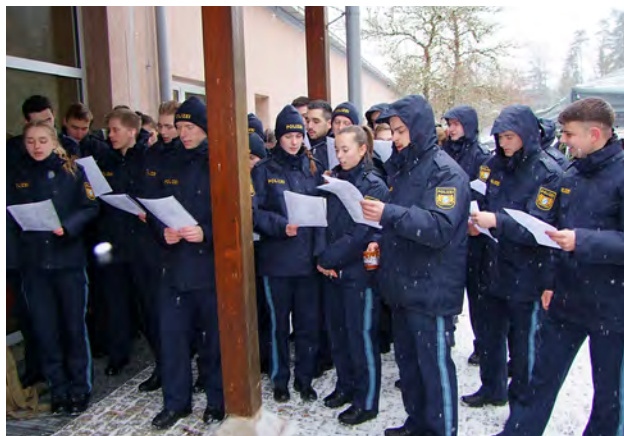
Chor der Studierenden in Sulzbach-Rosenberg

Gesellig wurde es in der Adventszeit am 14. Dezember. Das Team der Hochschule lud am Studienort Sulzbach-Rosenberg die Studierenden zu heißem Punsch und Bratwurstsemmeln ein. Die Dozentenband „School`s out“ sorgte für den musikalischen Rahmen und wurde gesanglich von Studierenden unterstützt.