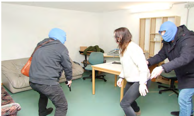
Simulierter Raubüberfall auf eine Kassiererin im OBI-Markt durch zwei bewaffnete Täter

liche Aspekte, wie z.B. Fälle der notwendigen Verteidigung, eingebaut, beleuchtet und geübt.