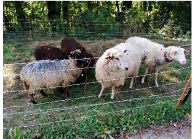
Die fünf Heidschnucken haben ihre Probezeit erfolgreich bestanden

Auch die Vereinbarkeit von Familie und Beruf wird bei uns großgeschrieben und gelebt. Die Kolleginnen und Kollegen, die den Großparkplatz määhnen, kommen nicht nur bei den Schulkindern, sondern im gesamten Kollegium gut an.