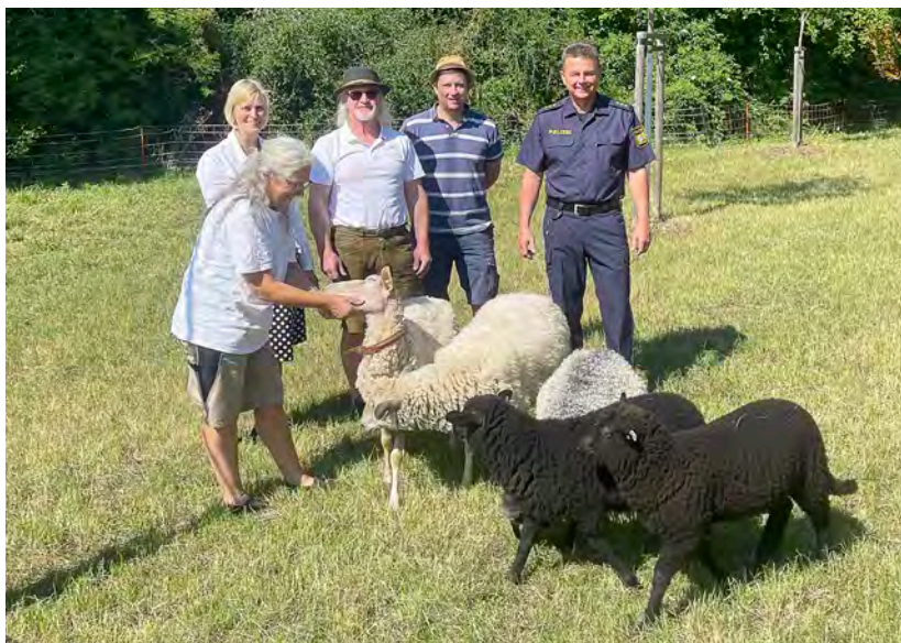
Tierisch was los in Kastl ...