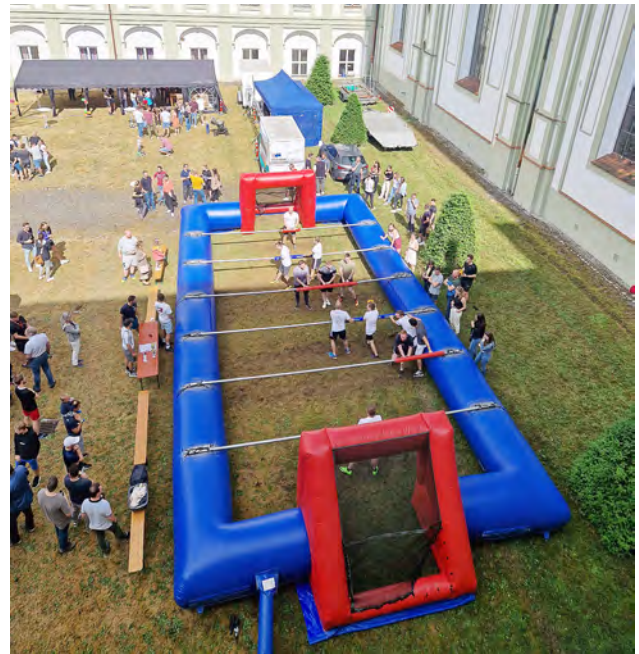
Der Menschenkicker, ein Highlight des Sommerfestes