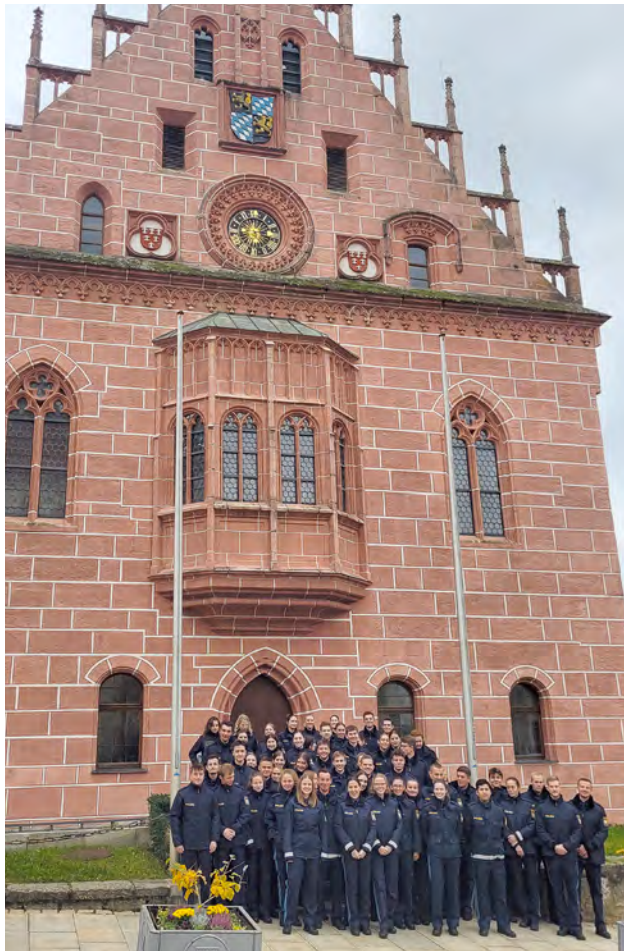
Die Studierenden des 1. bpA vor dem historischen Rathaus der Hochschulstadt Sulzbach-Rosenberg