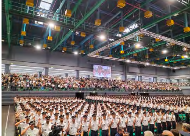
Die neuen Polizistinnen und Polizisten werden vereidigt

Am 29.07.2023 ging es für die Studierenden des 1. und 2. berufspraktischen sowie die Umsteiger des 1. fachtheoretischen Studienabschnitts nach Nürnberg in die Frankenhalle.