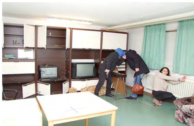
Die beiden Täter durchsuchen das Objekt und fesseln die Angestellte an den Heizkörper