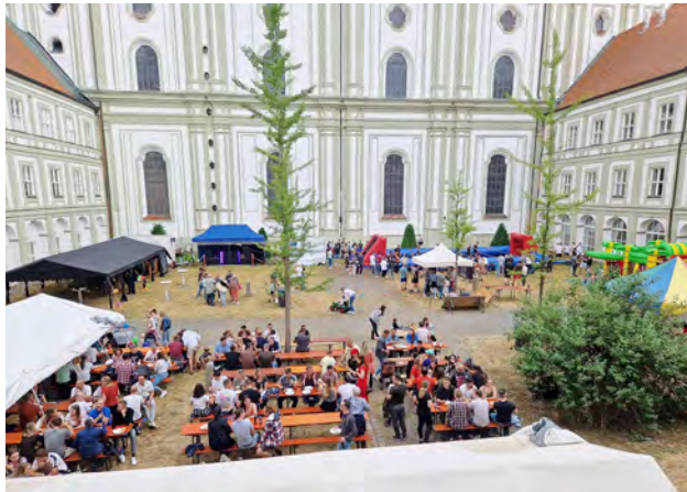
Wieder einmal war der klösterliche Innenhof Schauplatz der Feierlichkeiten

Am Mittwoch, den 05.07.2023 kehrte das Sommerfest des Standorts Fürstenfeldbruck nach einer coronabedingten Pause zurück. Es bot den ca. 350 (ehemaligen & zukünftigen) Studierenden, Dozenten, Angestellten der HföD und deren jeweiligen Angehörigen ab 15:00 Uhr die Möglichkeit zusammenzukommen, sich auszutauschen und gemeinsam zu feiern.