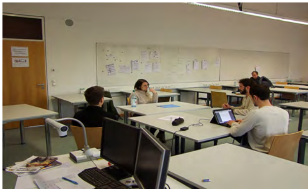
Anschließende Vernehmungssituation unter Beobachtung von Vernehmungsspezialisten (im Hintergrund)

Die andere Gruppe erhält den Auftrag, den Tatort abzarbeiten, dabei Spuren zu sichern, einen Tatbefund- und Spurenbericht sowie eine Lichtbildtafel zu erstellen. Dabei lernen die Studierenden zunächst, unter Anleitung der