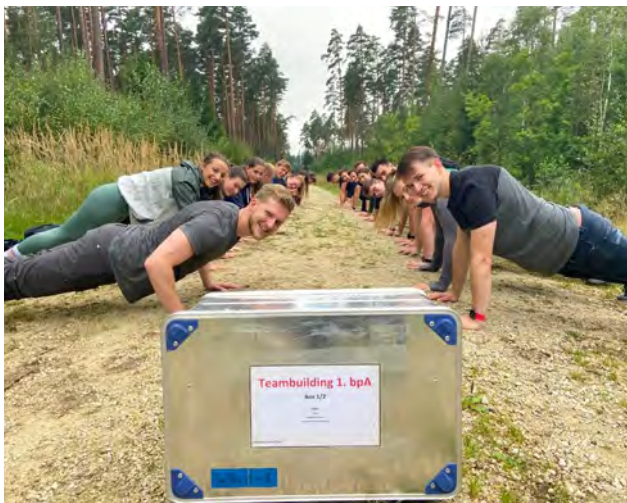
Teambuilding - wegen Bodybuilding auch sportlich eine Herausforderung

Knapp zwei Wochen nach Dienstantritt im September stand uns unser vermeintlicher „Wandertag“ bevor, der allerdings alles andere als nur eine einfache Waldwanderung im an die VII. BPA angrenzenden Naherholungsgebiet werden sollte. Zu Beginn des Tages erläuterten uns unsere drei Dozenten zunächst einmal, was uns in etwa grob erwarten würde. Die Studiengruppe wurde dann im Anschluss in 7 Kleingruppen aufgeteilt und kurz vor Abmarsch durfte unser Studiengruppen-Ältester noch aus zwei Umschlägen wählen, die jeweils eine besondere Aufgabe enthielten. Diese war von uns allen über den Tag hinweg zu erledigen.