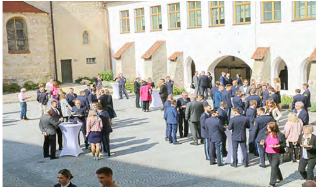
Gäste am Tag der Diplomierungsfeier im Innenhof der Klosterburg Kastl

223 neue Kommissarinnen und Kommissare für die Bayerische Polizei