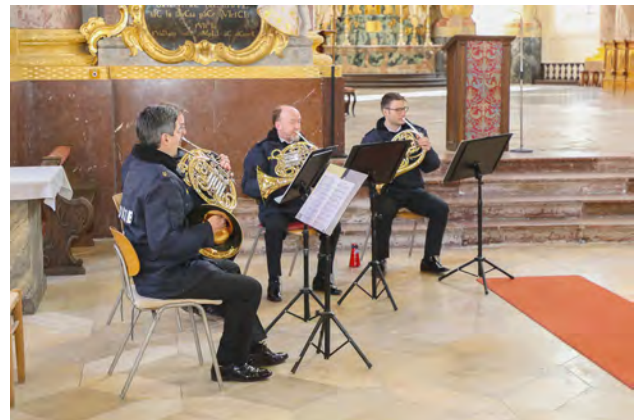
Das Bläserensemble des Polizeiorchesters Bayern - ein fester Bestandteil der Diplomierungsfeier

Der Festakt wurde musikalisch umrahmt von den „Weltmeistern an ihren Instrumenten“, vom Bläserquartett des Bayerischen Polizeiorchesters.