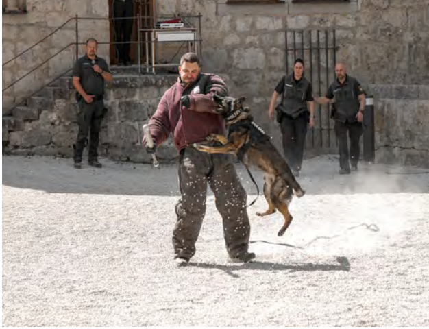
Vorführung der Diensthundestaffel: Der Polizeihund stellt einen "Autoknacker"

der Bergwacht fand großen Zuspruch. Dort waren Spezialfahrzeuge der genannten Sicherheitskräfte zu bestaunen, wie auch ein Polizeihubschrauber und Dienstpferde der Reiterstaffel sowie ein Sonderwagen SW 4.