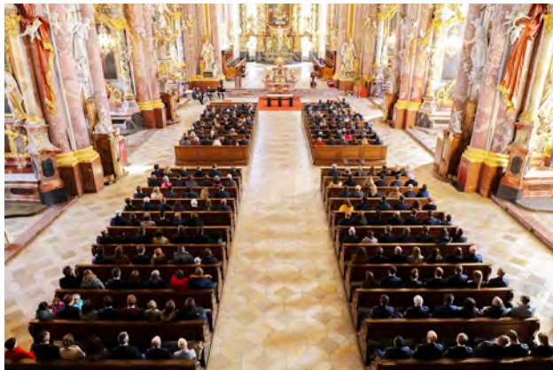
Traditioneller Gottesdienst in der Klosterkirche Mariä Himmelfahrt

Noch vor der ersten Diplomierungsfeier im September 2023 ( siehe Seite 11 ) feierten bereits 221 Diplomandinnen und Diplomanden ihren Abschluss. Am Dienstag, den 28. März 2023, waren sie mit ihren Partner/-innen, ihren Eltern und ihren Kindern, gemeinsam mit hochrangigen Vertretern des Bayerischen Landtages und der Kommunalpolitik, der Bayerischen Polizei und Justiz sowie der Hochschule für den öffentlichen Dienst in Bayern zu ihrer eigenen Abschlussfeier eingeladen.