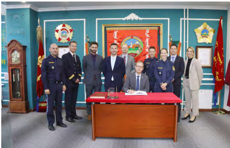
Die deutsche Delegation zu Gast an der Universität für innere Angelegenheiten