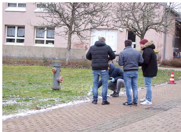
Parallel stattfindende Tatortarbeit, hier am Fluchtweg der Täter

Um die Tatortarbeit abwechslungsreich zu gestalten und dass sich alle Studierenden einbringen können, wird neuerdings – parallel zum Tatort des Raubüberfalls - ein neuer Tatort prä-