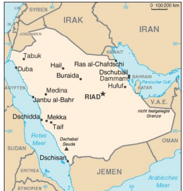
Abb. 3: Landkarte von Saudi-Arabien

Der überwiegende Teil der Bevölkerung spricht Arabisch oder einen arabischen Dialekt. Englisch kommt als Geschäftssprache nach und nach immer mehr zum Tragen. Im Land herrscht eine strikte Geschlechtertrennung, die sich auf alle Lebensbereiche auswirkt (z.B. getrennte Schulen, getrennte Gebetsräume, Bibliothekssäle für Frauen etc.). Frauen haben weniger Rechte als Männer, sie stehen stets unter einem männlichen Vormund und werden in vielen Rechtsfragen den Männern gegenüber benachteiligt (z.B. Erbrecht, Scheidungsrecht). Die Auf-