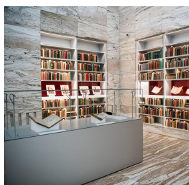
Abb. 6: Heritage Library in der QNL