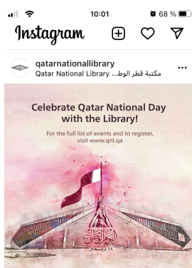
Abb. 4 und 5: Instagram-Posts der QNL