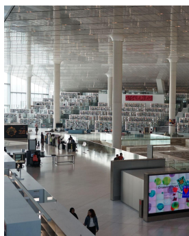
Abb. 7: Haupthalle der QNL